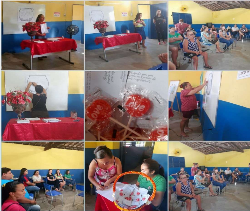
REUNIÃO PAIS E MESTRE