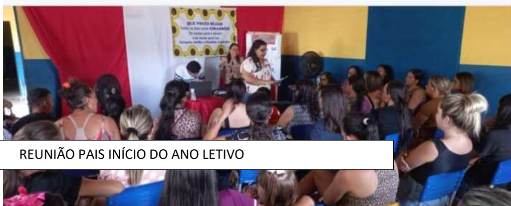
REUNIÃO PAIS INÍCIO DO ANO LETIVO