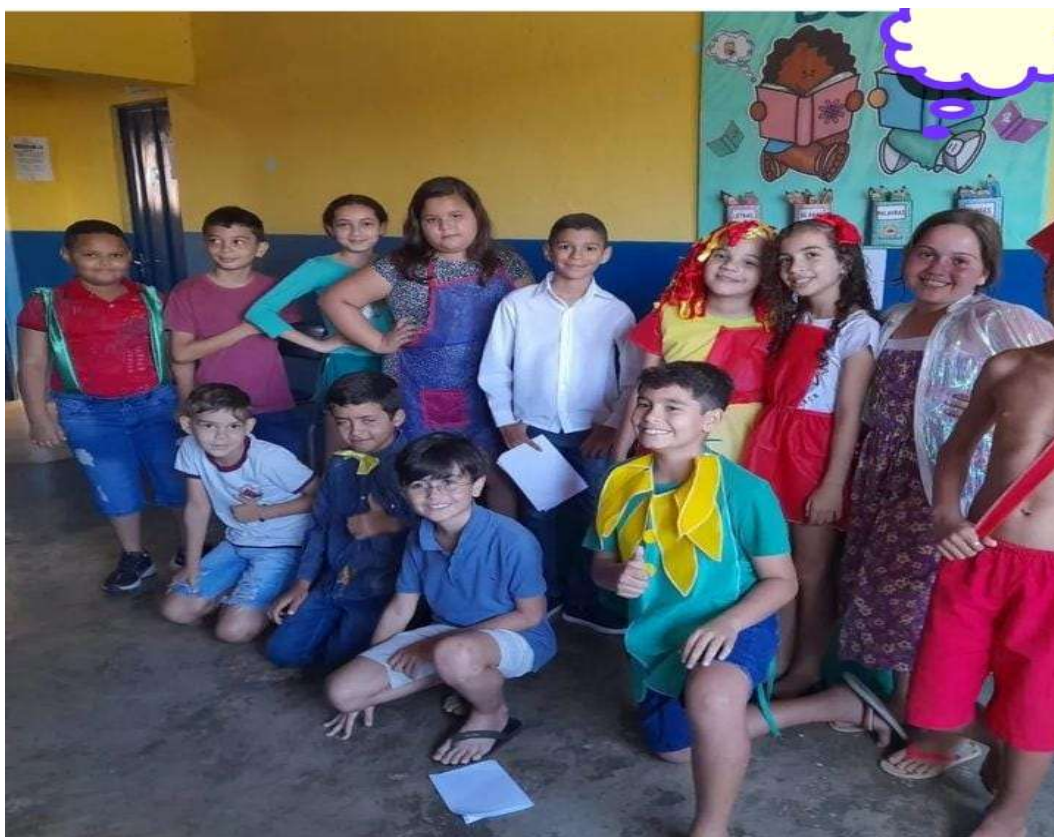
DIA DO LIVRO-AÇÃO DE LEITURA