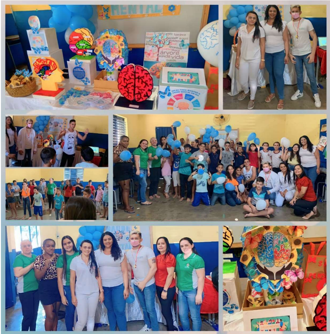
SAÚDE MENTAL NA ESCOLA