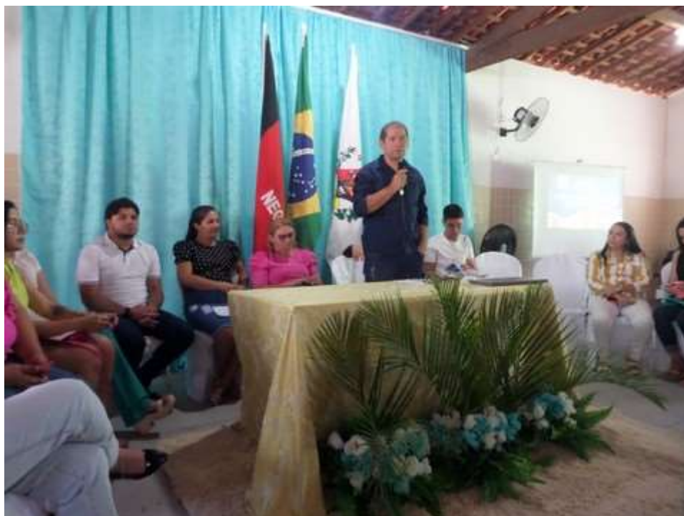
Construção de escola para o Ensino Fundamental e mais uma Creche