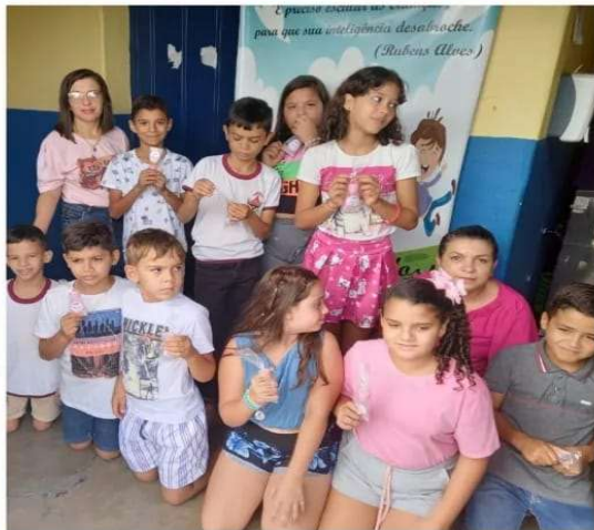
DIA DAS MÃES