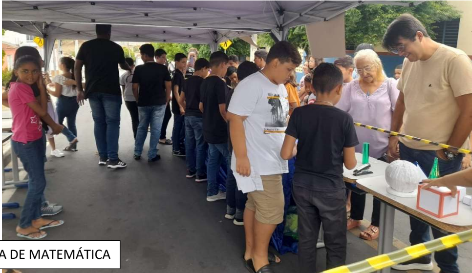
I FEIRA EXPOSITIVA DE MATEMÁTICA