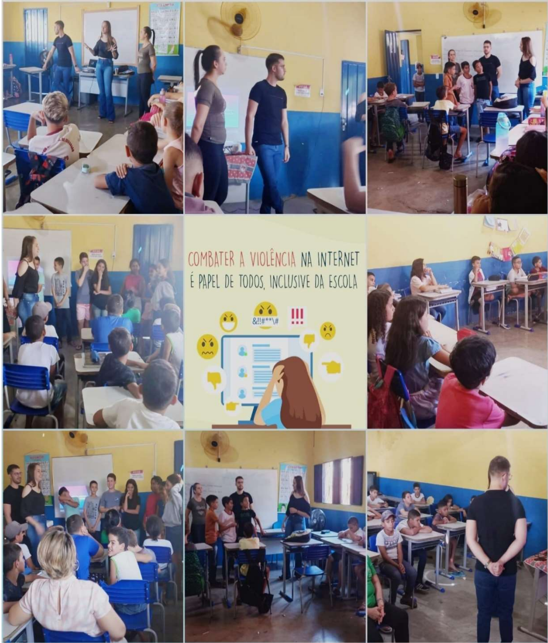
PALESTRA SOBRE O USO DA INTERNET