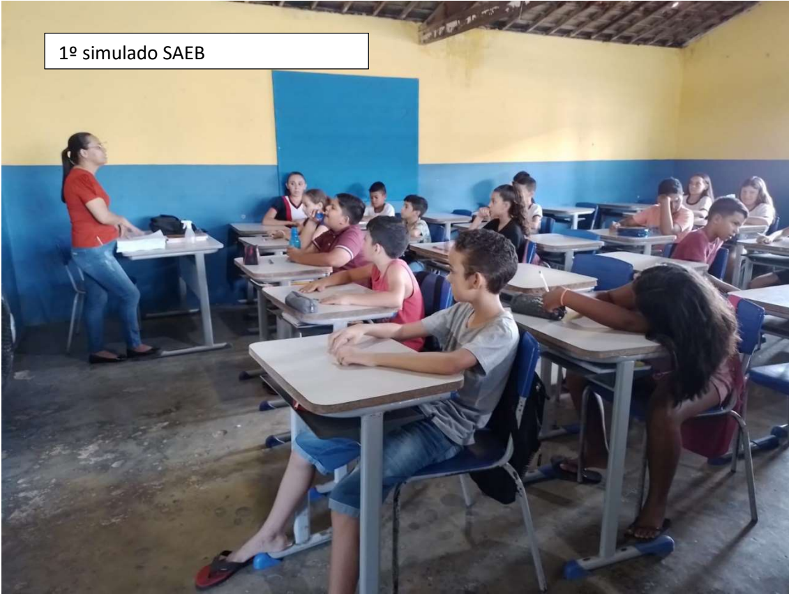
1º simulado SAEB