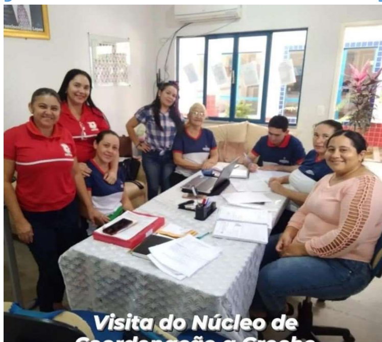
Visita do Núcleo de Coordenação a Creche Municipal.