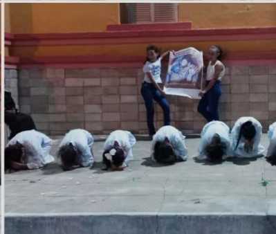
APRESENTAÇÃO TEATRAL NA IGREJA