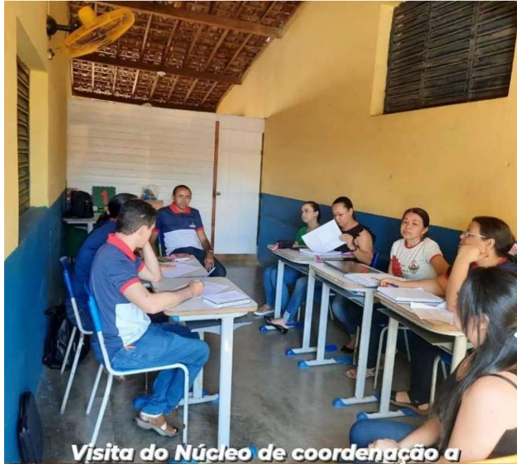
Visita do Núcleo de coordenação a Escola Joana Lacerda Leite.