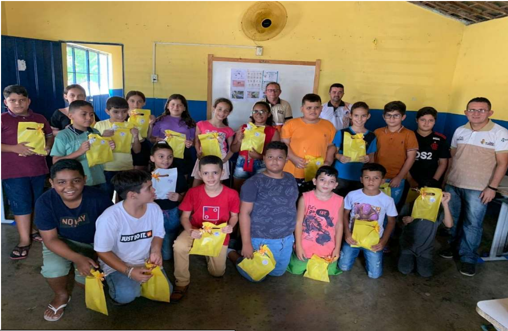
AÇÃO EM PARCERIA COM AGENTE DE ENDEMIAS