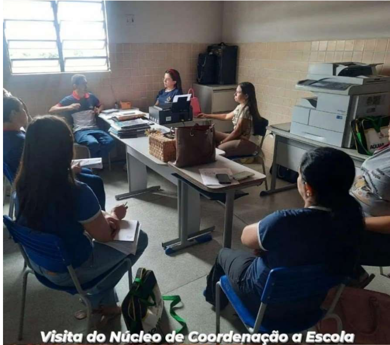
Visita do Núcleo de Coordenação a Escola Lídia Cabral.