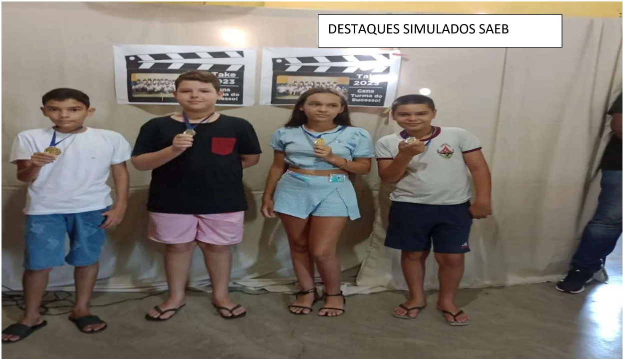
DESTAQUES SIMULADOS SAEB