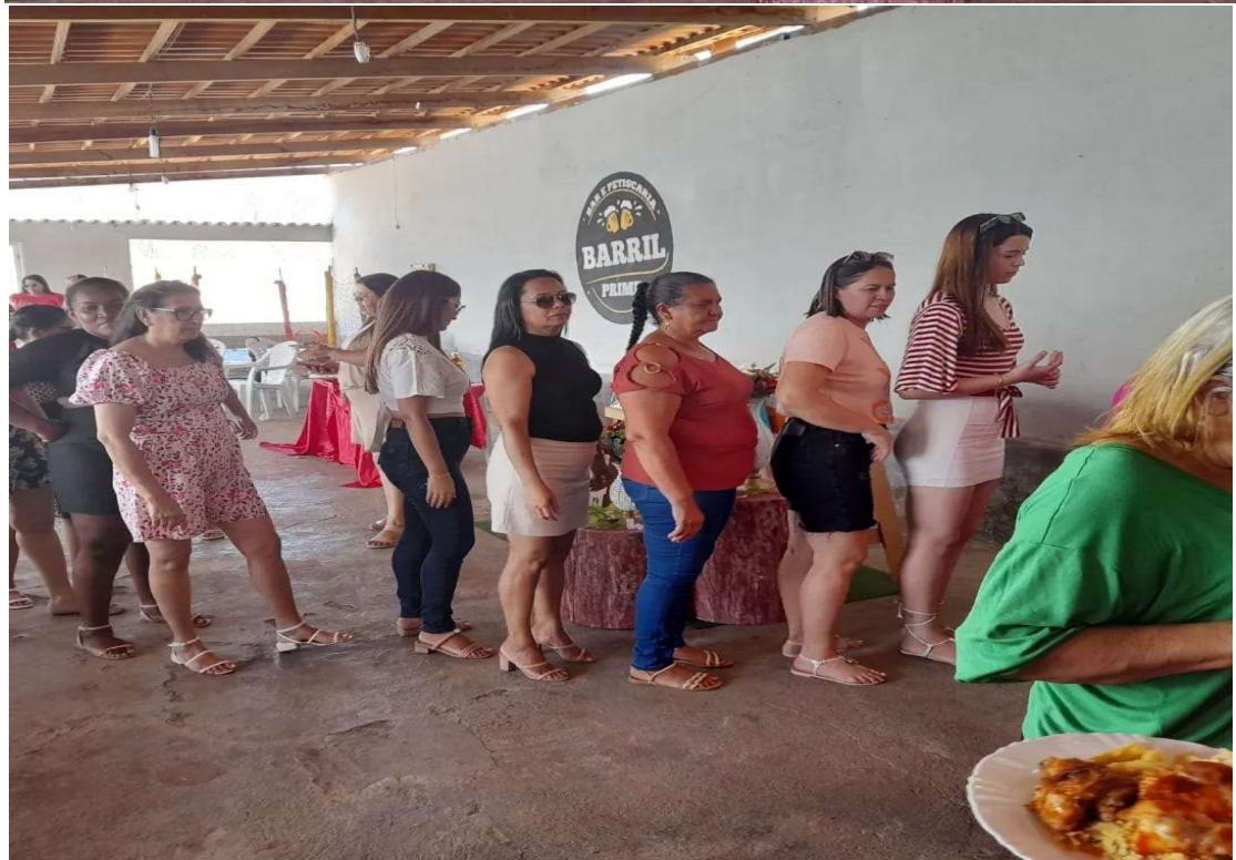
CELEBRAÇÃO DIA DO PROFESSOR